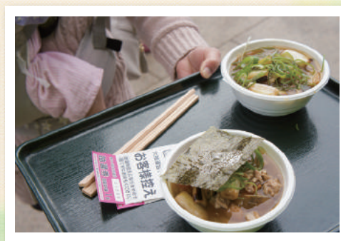
※写真は前回開催の様子です