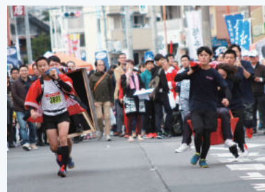
※前回開催の様子です